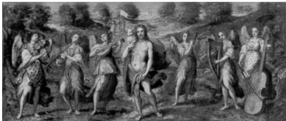
Kristus jako dobrý pastýř s anděly, Středoitalský malíř, kolem r. 1550

Kroměřížský zámek patří mezi nejcennější historické objekty v českých zemích. Jedinčnost církevní rezidence, jejích uměleckých sbírek, Podzámecké a Květné zahrady byla nedávno stvrzena zapsáním celého areálu na prestižní seznam Světového kulturního a přírodního dědictví. Toto ocenění na jedné straně jistě povede ke zvýšení návštěvnosti a tím i k většímu přílivu financí, na druhé straně s sebou přináší též povinnost udržovat komplex v dostatečně reprezentativním stavu a zároveň jej v mezích možností učinit pro turisty co nejatraktivnějším. Nutno poznamenat, že správa zámku v této věci opravdu nezháhá. Došlo ke zpřístupnění věže, v nedaleké mincovně byla otevřena expozice ražeb olomouckých biskupů, ke konci se v současnosti chýlí roz-