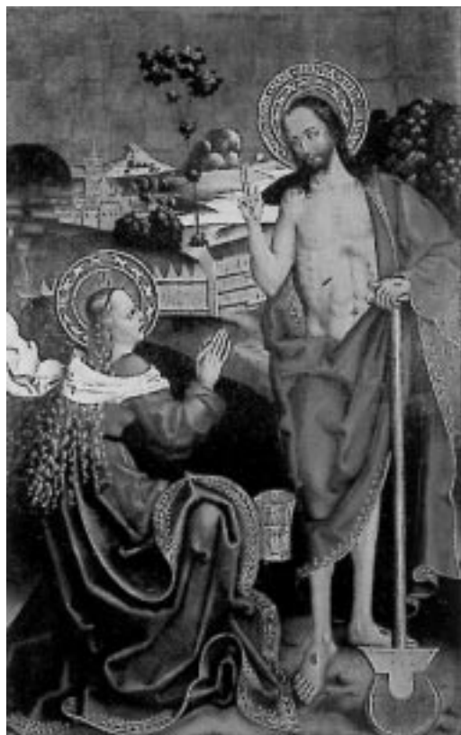
Noli me tangere, začátek 14. stol.

Specifické podmínky – zejména značný geografický rozsah problematiky a rádius odborné působnosti několika významných muzejních a galerijních institucí – byly důvodem, proč po počátečních diskusích nakonec zvítězila poněkud neobvyklá koncepce tří svébytných, avšak dobrou konání paralelních výstav v Brně, Olomouci a v Opavě. Toto řešení umožnilo jednak soustředit jedinečné kolekce exponátů s ohledem na jejich regionální příslušnost a současně lépe vystihnout určité zvláštnosti či odlišnosti umělecké situace jednotlivých regionů, které