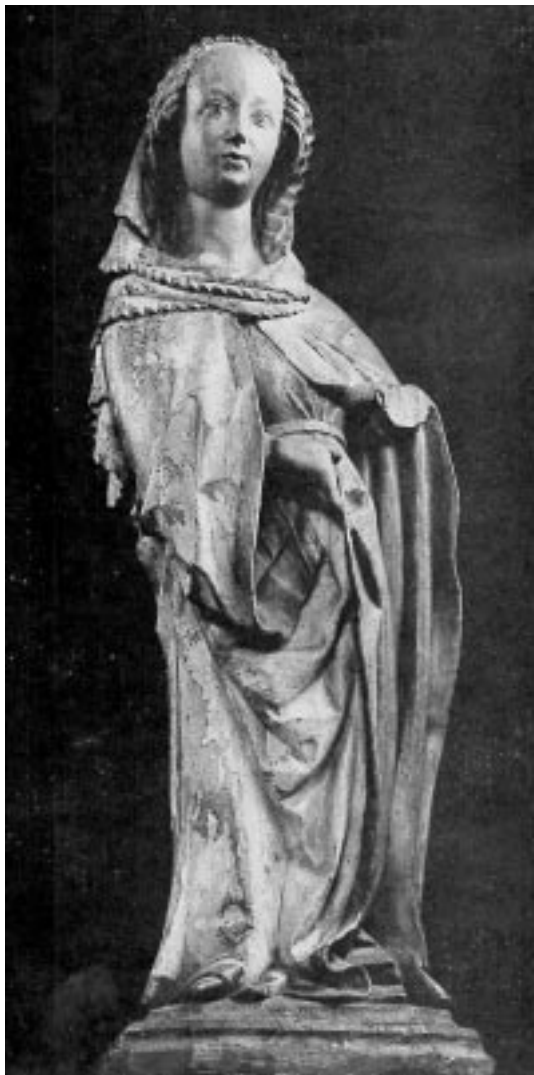
sv. Marie Magdaléna ze Sv. Majdaleny, před r. 1450