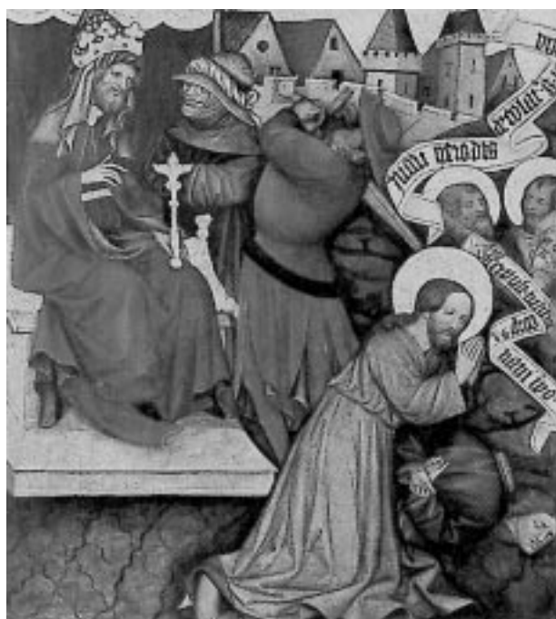
Mistr rajhradského oltáře, svatojakubský oltář, před r. 1450

Výstavou, která bude zahájena 14. října tohoto roku v Brně, 21. října v Opavě a 26. října v Olomouci vrcholí významná etapa výzkumné a badatelské práce na náročném výzkumném projektu, započatém v roce 1996. Na jeho realizaci úzce spolupracovaly