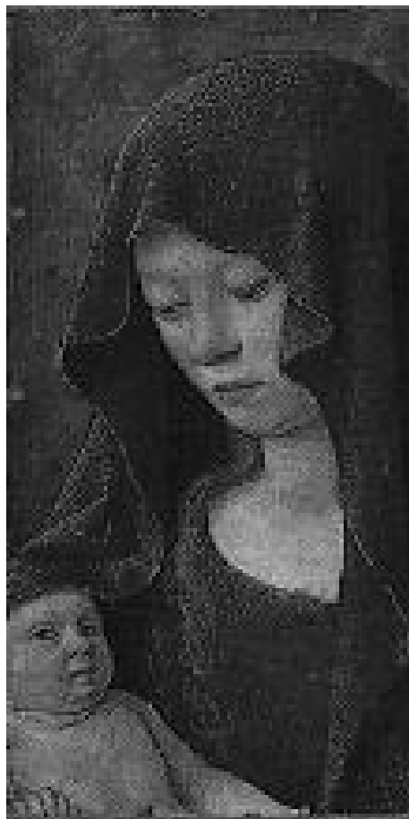
Detail snímku ze strany 12; při pohledu s lupou je již možné rozeznat čtvercové pixely.

Článek je v dispozici na Internetu na adrese: http://www.ff.cuni.cz/~johana/texty/index.html