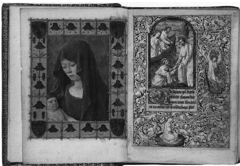
Ukázka digitálního, barevného záznamu rukopisu z Kodaňské národní knihovny, který byl zkopírován po Internetu - soubor má velikost 750 Kb a v kompresi JPEG 250 Kb

vajícími autory. Oba tyto faktory zřejmě do budoucna způsobí, že na Internetu budeme stále více nalézat nejen informace typu „prezentace firmy“ či „seznam adres“, nýbrž i publikované vědecké projekty, které se nebudou v ničem podstatném lišit od dnes běžných klasických způsobů zveřejnění (budou